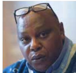
TEXT: MAINA KIAI , UN SPECIAL RAPporteur ON THE RIGHTS TO FREEDOM OF PEACEFUL ASSEMBLY AND OF ASSOCIATION.

Gender-based violence and discrimination keep women from accessing rights and improved working conditions, a UN-report states.