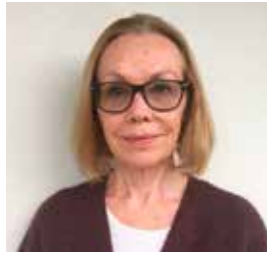
TEXT: ARNI HOLE , PHILOSOPHER AND INDEPENDENT CONSULTANT. FORMER DIRECTOR GENERAL IN THE MINISTRY OF CHILDREN AND EQUALITY AND IN THE MINISTRY OF AGRICULTURE AND FOOD. ✉ ARNIHOLE