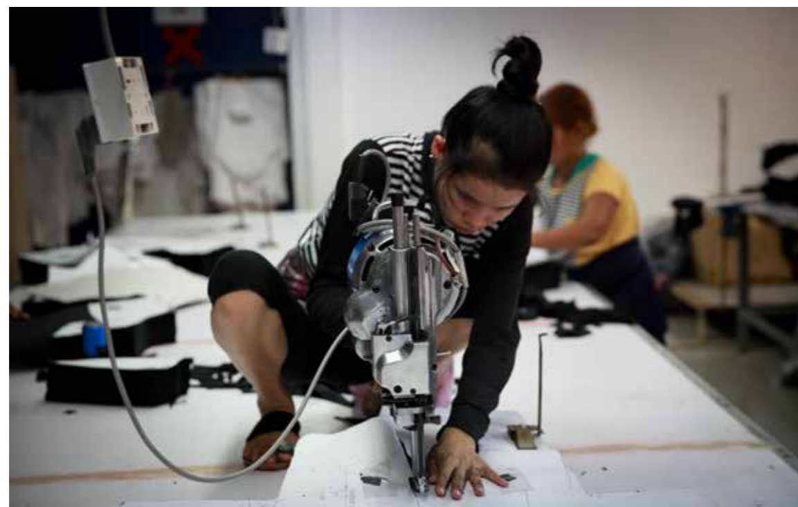
Klesindustrien står for 75 % av Kambodsjas eksportinntekter.

ellers dattet oppmerksomheten av etter en tid og dermed også presset på bransjen. Men katastrofen førte til enkelte viktige forbedringer for arbeiderne i tekstilindustrien i Bangladesh. Det er blant annet blitt forbudt å låse arbeiderne inne, og alle fabrikkene skal inngå i kontrollprogrammer for brannvern, elektriske anlegg og bygningsmessig sikkerhet.