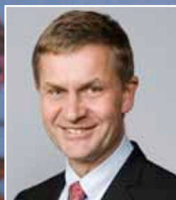
Erik Solheim Miljø- og utviklings- minister