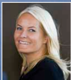
HKH Kronprinsesse Mette-Marit