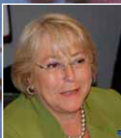
Michelle Bachelet Under Secretary General and Executive Director, UN Women