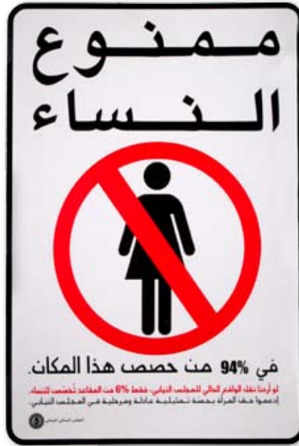
Plakat fra LCWs kampanje for kvinnlig kvotering i parlamentet med teksten "Forbudt for kvinner" med henblikk på den kvinnelige underrepresentasjonen i parlamentet.