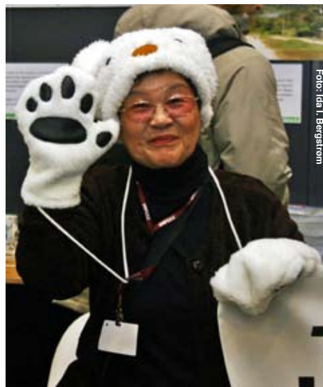
Før var det isbjørnen, nå er det en 'sårbar' kvinne som representerer klimastereotypen.

– Vi diskuterte det senest i morges – skal vi drive lobbyvirksomhet overfor miljøorganisasjonene eller landdelegatene? Det er mye lettere for oss å jobbe mot regjeringsrepresentanter. Fra miljøorganisasjonene får vi alltid bare høre at først må vi løse klimakrisen, så kan vi tenke på andre ting.