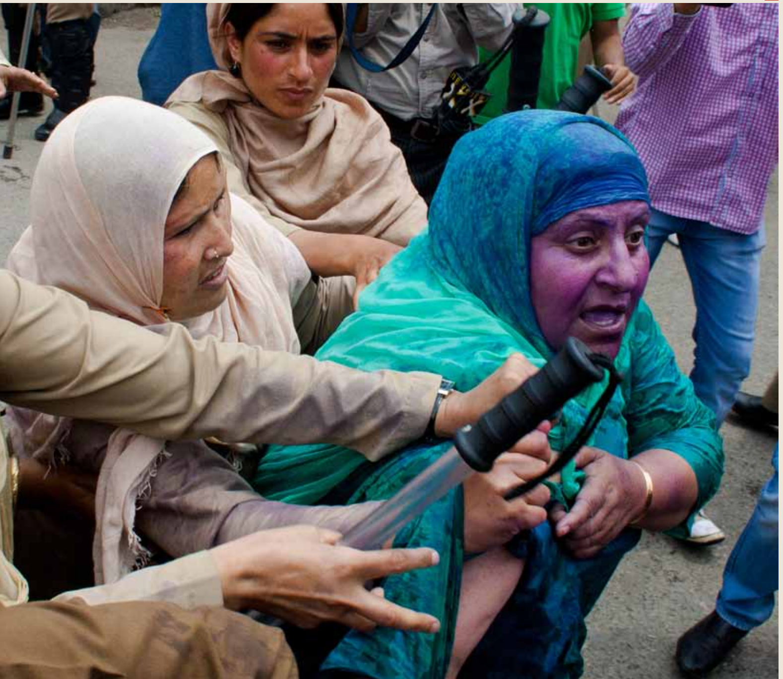
Kashmir Employees Protest Against Government