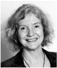
TEKST: PROFESSOR DRUDE DAHLERUP LEADER OF WOMEN IN POLITICS RESEARCH CENTER