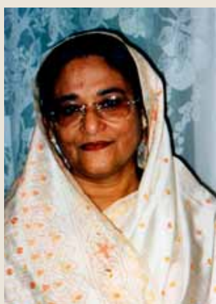
Statsminister i Bangladesh 1996-2001 og 2009 - : Sheikh Hasina. Bildet er tatt i Dhaka i 2003 mens hun var i opposisjon.