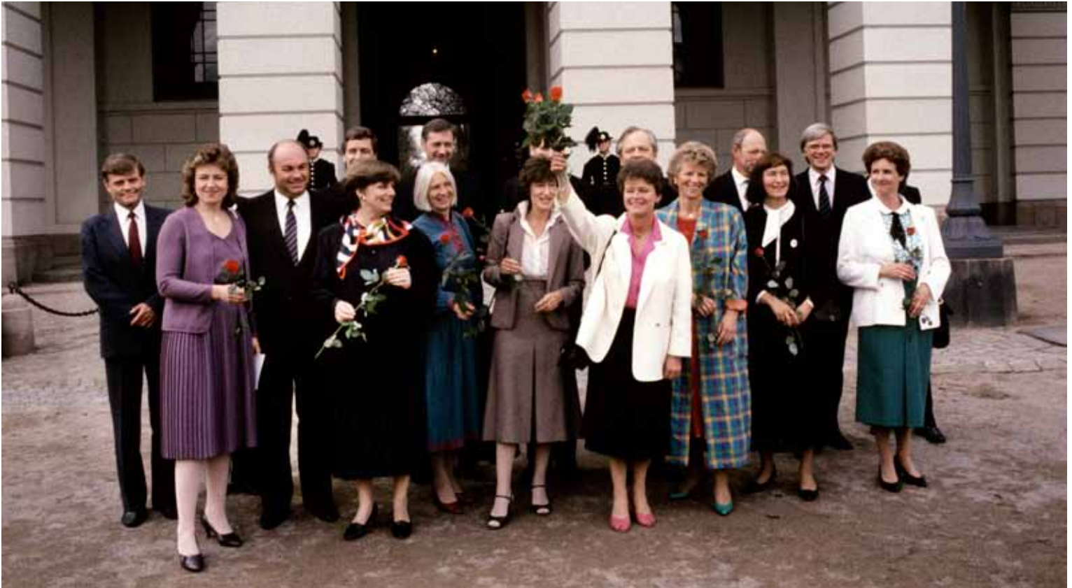
Statsminister Gro Harlem Brundtland og hennes regjering på Slottsplassen 1986.