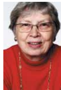
TEKST OG FOTO: TORILD SKARD SENIORFORSKER, TIDL. POLITIKER OG FN-DIREKTØR