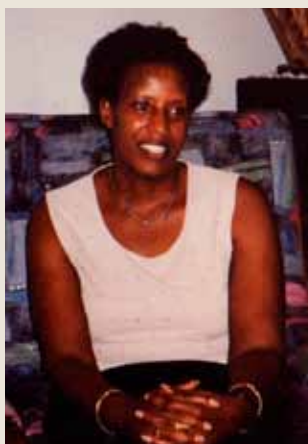
Statsminister og fungerende president i Burundi i 1993-4: Sylvie Kinigi. Bildet er tatt etter at hun gikk av, i Malabo 1999.