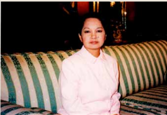
President i Filippinene i 2001-2010: Gloria Macapagal-Arroyo. Bildet er tatt i presidentens mottakelsesrom i Manila i 2003.

Fra 1960 til 2010 har i alt 73 kvinner vært president eller statsminister i til sammen 53 land i nord og sør, øst og vest. Først