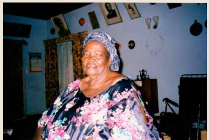
Statsminister i den Sentralafrikanske republikk 1975-76: Elisabeth Domitien. Bildet er tatt hjemme hos henne i Bangui i 1999.

framgangen selv om menn hadde større utbytte av det som skjedde. Helse, utdanning og inntekt er viktig for folks utfoldelse og samfunnsdeltakelse. Men det er ikke tilstrekkelig for at kvinner skal få være med og styre.