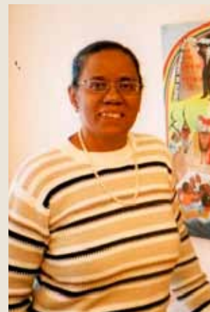
statsminister i Haiti 1995-96: Claudette Werleigh. Bildet er tatt i 2006 i Uppsala.

«Kvinnene overtar verden!» forkynte The Independent da Australia fikk sin første kvinnelige statsminister i 2010. De tok litt hardt i. I verdens parlamenter utgjør i dag kvinnene ikke mer enn 20 prosent og i regjeringene 17. Og det er bare 9 prosent av verdens stater som har kvinnelig stats- eller regjeringssjef. Riktignok er dette ny rekord, men det er sannelig et stykke igjen før kvinnene har makten på kloden!