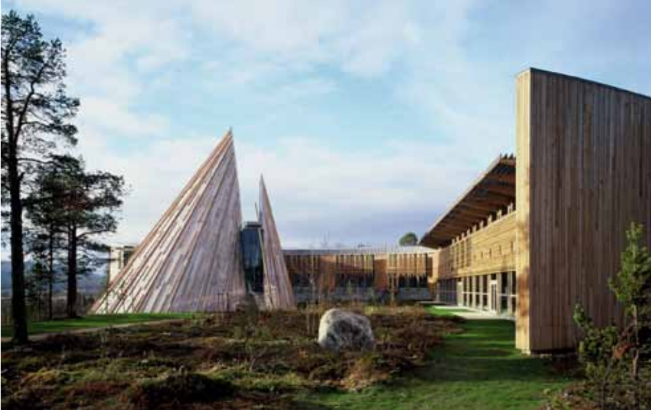
Sametingsbygningen i Karasjok ble offisielt åpnet 2. november 2000. Sametingsbygningen huser samenes folkevalgte forsamling og administrasjonen for Sametinget i Norge.

sjonsprosess. Dette styrker kjønnsbalansen i Sametinget. Samtidig vet vi som arbeider med likestilling generelt at dette er et tema som krever kontinuerlig fokus.