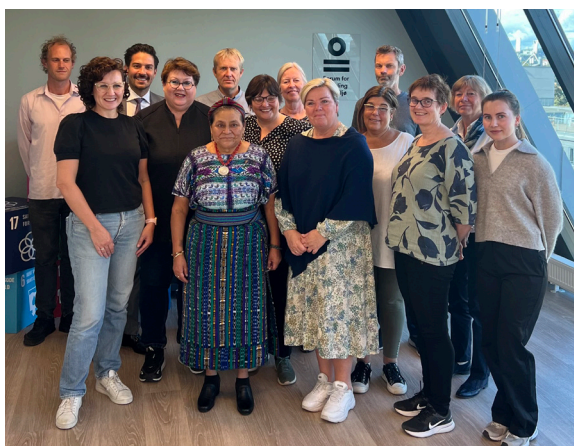
FOKUS' styre og sekretariat møter fredsprisvinner Rigoberta Menchú.

Hennes Kongelige Høyhet Kronprinsesse Mette-Marit er høye beskytter for FOKUS.