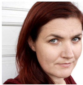
Av MAREN SÆBØ

Kvinner har gått fra å være skjulte ofre i krig, til å bli aktive deltagere i arbeidet for å sikre freden. Men det blir sjelden fred uten rettferdighet, og for tusenvis av kvinner som hvert år voldtas i en konflikt, eksisterer den stadig ikke.