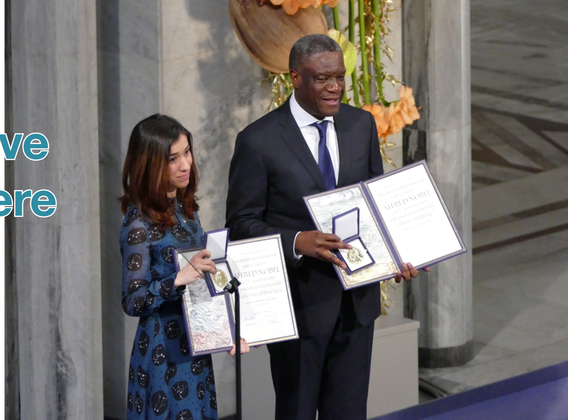
Nadia Murad og Denis Mukwege mottar Nobels fredspris i 2018.

Men fredsprisen var ikke bare en anerkjennelse av to usedvanlig modige forkjemperer for voldtatte kvinner. Den var også en anerkjennelse av et felt som de siste tretti årene har fått økt oppmerksomhet. Bevisstheten rundt kvinners roller, både som ofre for vold og som aktive deltagere i konfliktløsning og fredsbygging har blitt større. Mye av dette kan spores tilbake til Beijing-konferansens plan om å synliggjøre og dokumentere seksuell vold mot kvinner i krig.