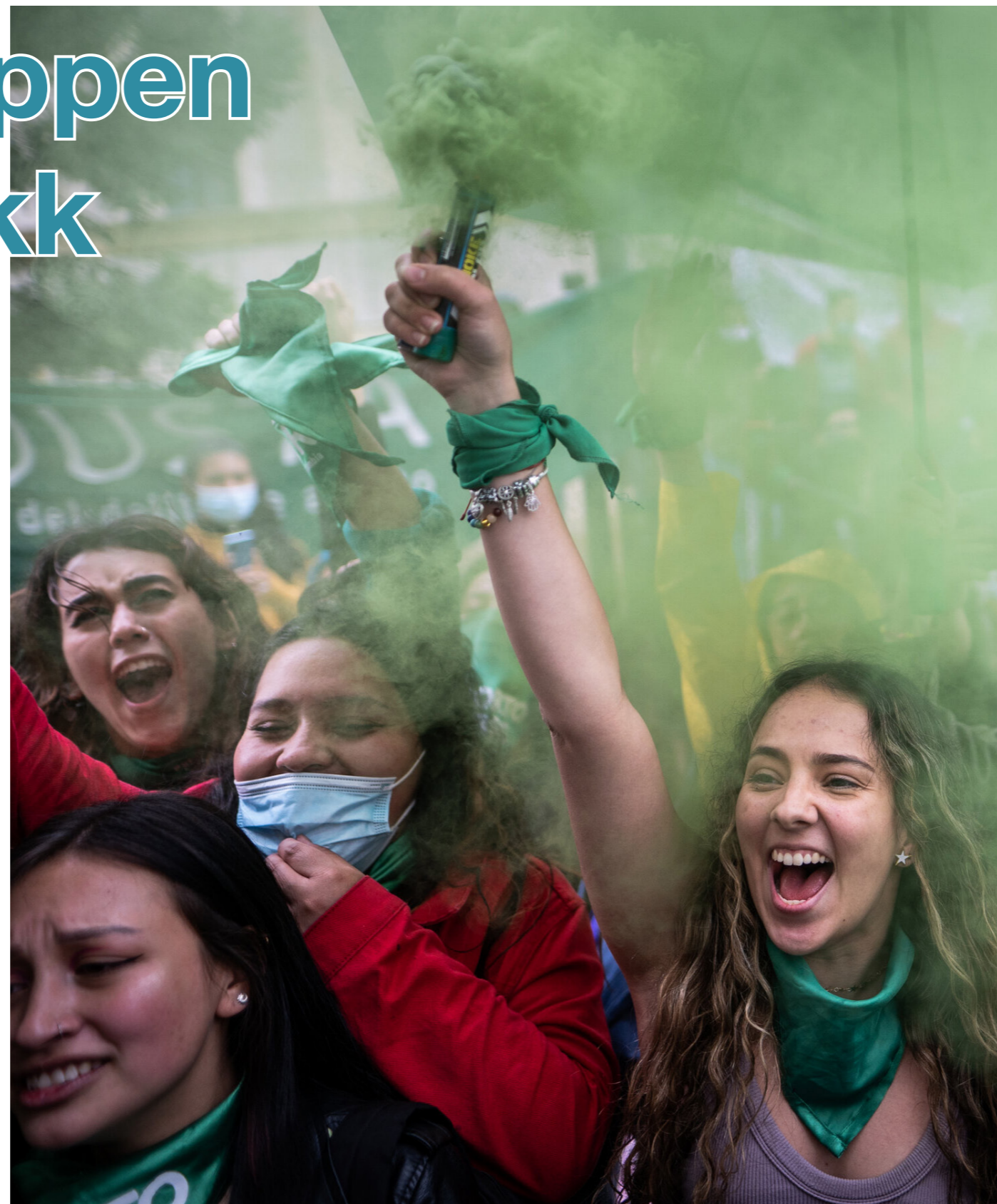
Colombianske kvinner demonstrerer for selvbestemt abort.

I USA har 22 stater innskrenket retten til abort etter en høyesterettsavgjørelse i 2022. I 14 av disse statene er det lagt ned et forbud mot abort. Dette har både ført til høyere mødredødelighet og et lite hopp i antallet spæbarn som dør i USA.